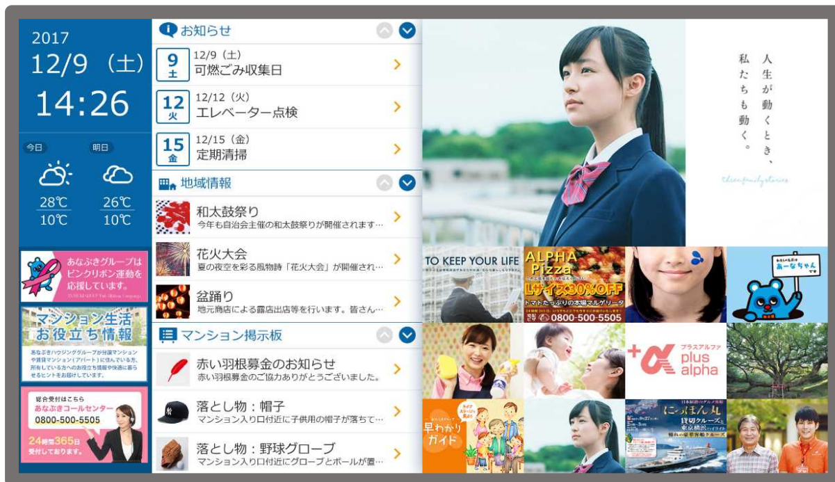
デジタルサイネージイメージ